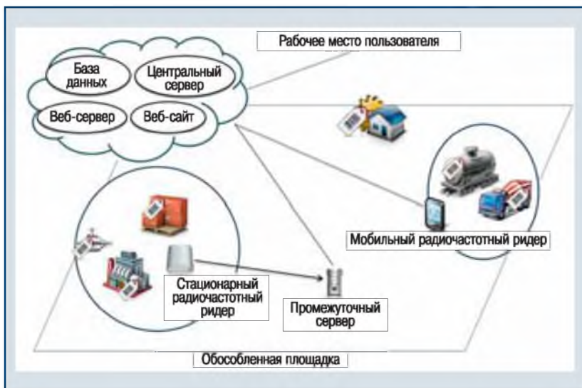
▲ Рис. 1. Схема организации дистанционного контроля за ОПО

Предлагаемая технология [2–4] включает операцию маркировки различных объектов (ОПО; их составляющие; обособленные площадки и установки, ограниченные кадастровой границей с ее координатами; мобильные и стационарные ТУ; здания и (или) сооружения, входящие в состав ОПО) радиочастотными метками с кодами, индивидуально идентифицирующими конкретный объект маркировки, позволяющими ввести сведения о его местоположении, технических характеристиках, параметрах, экспертизе, диагностике, ремонте и пр. На рис. 1 представлена схема организации дистанционного контроля за ОПО на базе информационно-коммуникационной технологии с использованием средств радиочастотной идентификации.